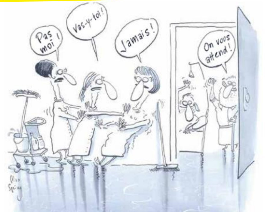
Illustration : brochure ASI