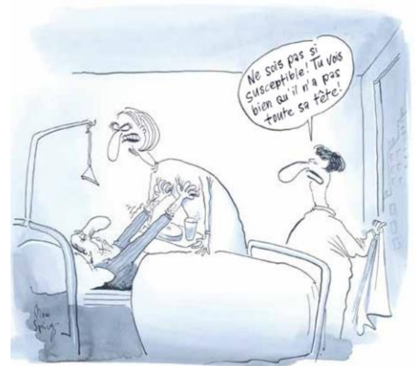
Illustration : brochure ASI